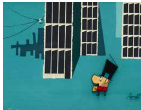
De valse noot, 1963

Havenlichten vertelt het verhaal van een visser die in een storm verdwaald is geraakt op zee. Dankzij een kleine, dappere lantaarntje aan de kaai vindt hij zijn weg naar het vasteland terug. Aan welke haven denk jij dat hij weldra zal aanmeren?