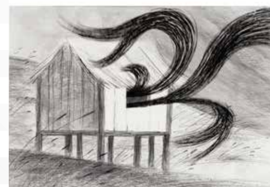
Winter days, 2003

Sirene wordt gedurende de hele film gekleurd in blauw en rood. Blauw als symbool voor het romantische, sentimentele en liefdevolle; rood voor het dramatische, dreigende en beangstigende. Wat zou jij in je leven blauw en rood kleuren?