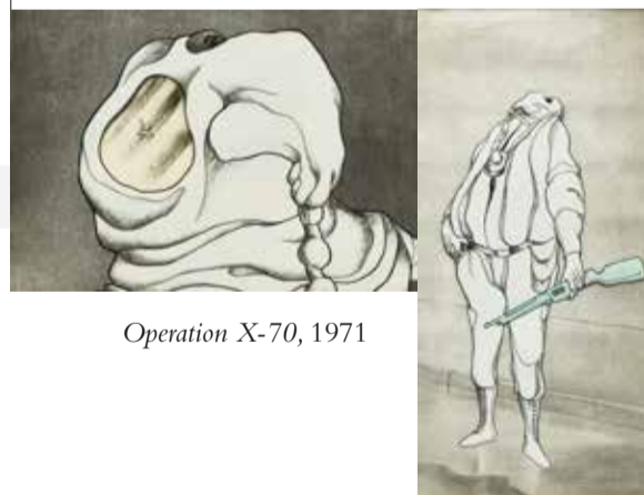
Operation X-70, 1971

In Operation X-70 wordt er geëxperimenteerd met een nieuw oorlogsgas. Wanneer deze per ongeluk gedropt wordt, blijkt het gifgas een heel bijzonder effect op mensen te hebben. Wetenschappers zijn stomverbaasd over de effecten van het gas op mens en dier. Ze staan er bij en kijken er naar, letterlijk. Maar naar wat kijken ze precies? Teken jij in het witte vak het effect van het oorlogsgas waar deze wetenschappers zo verbaasd naar staan te kijken? (ontdek ook een tip in de tekening!)